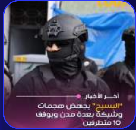
أخر الأخبار "اليسيج" يجهز هجمات وشبكة بعدة مدن ويوقف 10 متطرفين

وحسب المعطيات المعلنة، مكنت التدخلات التي نفذها المكتب المركزي للأبحاث القضائية، بناء على معلومات دقيقة من المديرية العامة لمراقبة التراب الوطني، من توقيف عشرة أشخاص يشتبه في ارتباطهم بخلية موالية لتنظيم "داعش".