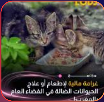
ممنه غرامة مالية لإطعام أو علاج الحيوانات الضالة في الفضاء العام المغرب

صادق مجلس المستشارين بالأغلبية على قانون جديد يقضي بفرض غرامة مالية تتراوح بين 500 و2000 درهم على كل من يقوم بإيواء، إطعام، أو علاج حيوان ضال في الفضاء العام. وجاءت هذه الخطوة التشريعية بعد حصول مشروع القانون على 25 صوتاً مؤيداً مقابل صوت واحد معارض و6 ممتنعين، وذلك عقب مصادقة مجلس النواب عليه سابقاً في 29 يونيو الماضي.