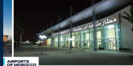
AIRPORTS OF MOROCCO مطارات المغرب