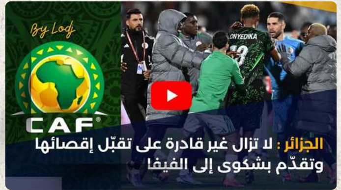
الجزائر : لا تزال غير قادرة على تقبل إقصائها وتقدم بشكوى إلى الفيفا