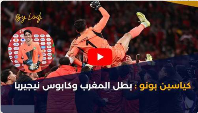
كياسين بونو : بطل المغرب وكابوس نيجيريا