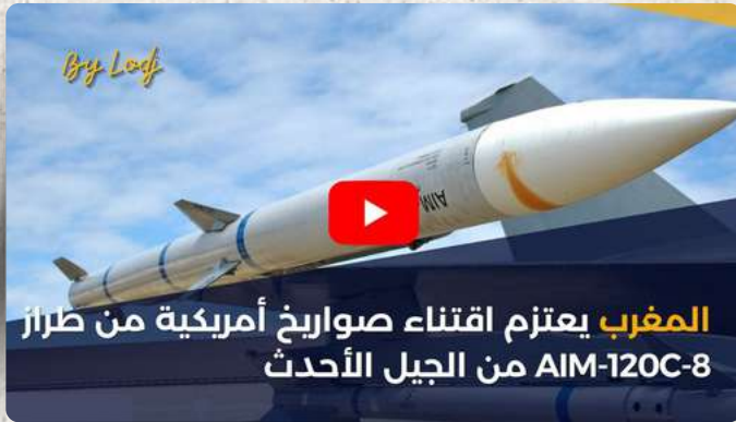
المغرب يعتزم اقتناء صواريخ أمريكية من طراز AIM-120C-8 من الجيل الأحدث