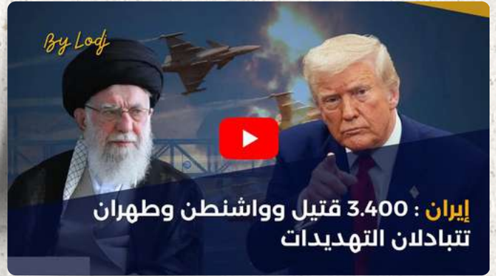
إيران : 3400 قتيل وواشنطن وطهران تتبادلان التهديدات